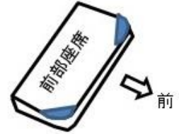
(コーナー補強タイプ)