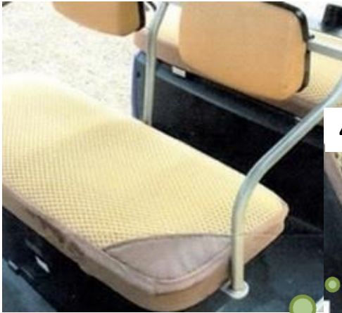
4 コーナー(四隅レーザータイプ)

写真は13MMSタイプ(色: ベージュ) 13MMSタイプは逆浸透膜しにくい素材です。